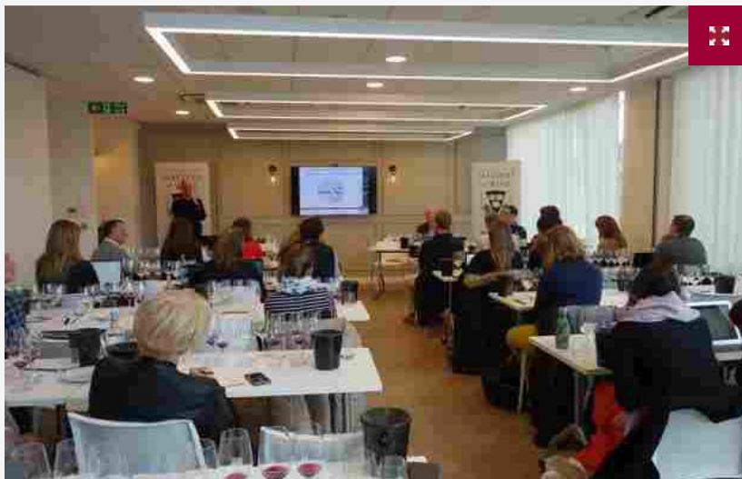
Dal 24 al 26 maggio in scena la Masters of Wine Residential Master Class

Avrà come location l'Alto Adige l'edizione italiana n. 8 della Masters of Wine Residential Master Class, il corso dedicato a tutti gli aspiranti Masters of Wine , il titolo più ambito del mondo enoico, di cui l'Italia è ancora sprovvista. Dal 24 al 26 maggio andranno in scena gli esclusivi corsi alla Tenuta Alois Lageder a Magrè (Bolzano), promossi dall'Accademia londinese in partnership con l' Istituto del Vino Italiano di Qualità Grandi Marchi , che permetteranno di avvicinarsi alle tecniche di degustazione e alle abilità analitiche fondamentali per accedere al selettivo study programme dell'Istituto che partirà a giugno. Target principale della Master Class sono, non a caso, tutti i professionisti del vino che desiderano approfondire